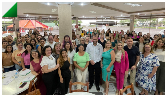
Programa SEDEF nos Municípios começa no Sudoeste.